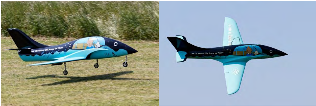
Quelques modèles en vols ce jour-là