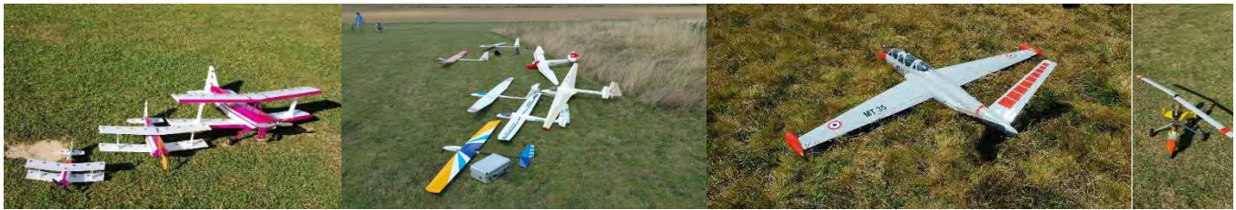
Exemples de réalisation