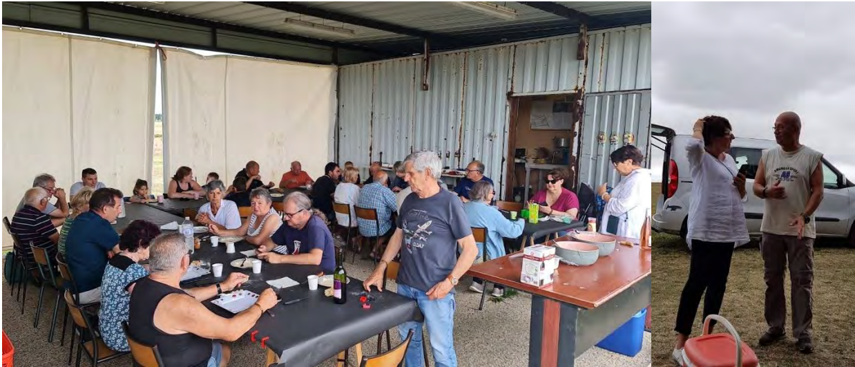
Tous à table et la Première Dame en discussion stratégique avec le secrétaire 😊