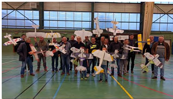
Le plateau du concours