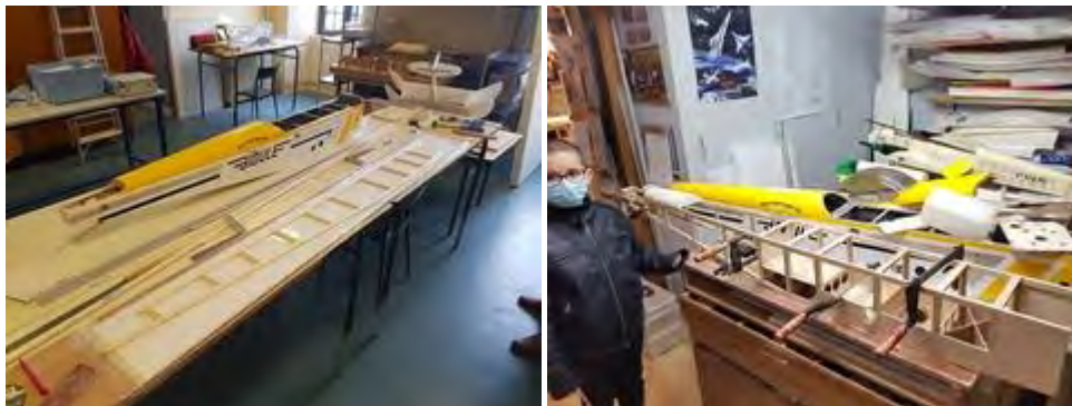
Un jeune apprenti devant la réalisation de Jean-Claude