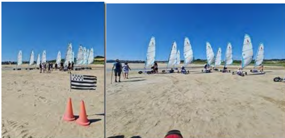
Les chars à voile du Bout du Monde