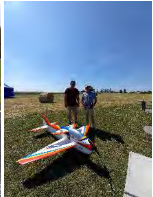
Chateau-Renault : avec mon coach JC