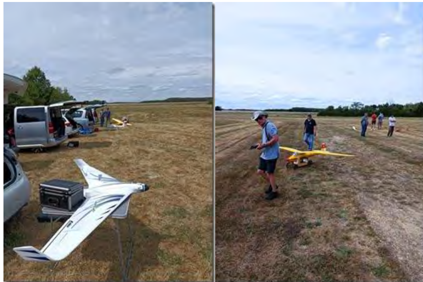
L'équipe d'Issoudun sur le tarmac.

L'accueil du président a été chaleureux, une quinzaine de pilotes des clubs voisins du Cher et du Loire et Cher sont venus compléter l'équipe d'Air Modèle Issoudun pour passer cette agréable journée.