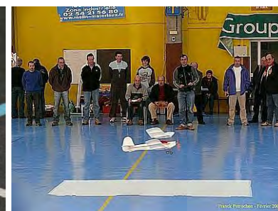
Gymnase Jean Macé