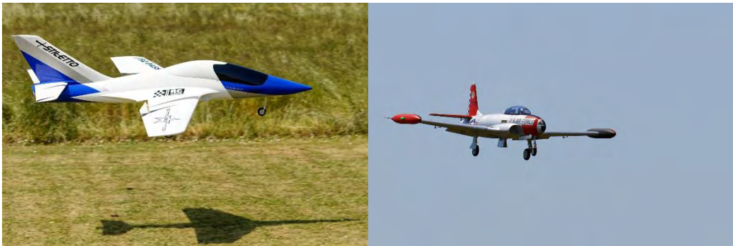
Cherchez l'erreur 😊