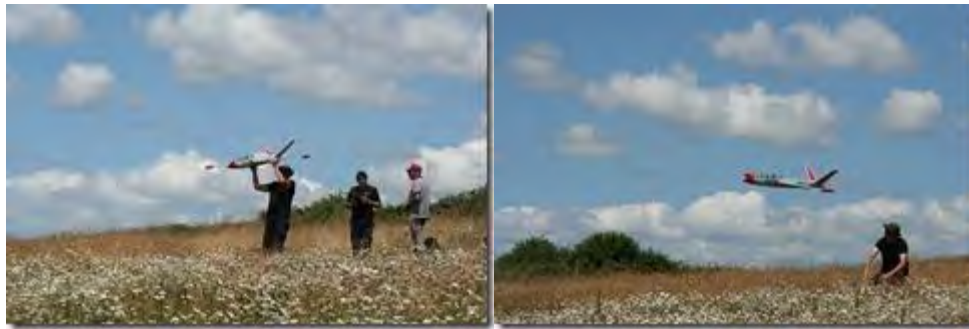
Le Fougas Magister de Doudou au décollage