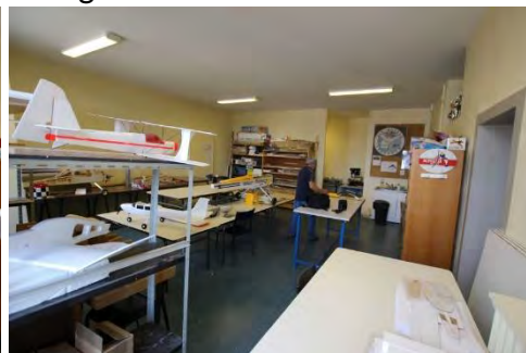
La grande salle de construction sous plusieurs angles

Notre atelier, situé à la maison des associations d'Issoudun (Centre Jardon), rue du 4 août, est maintenant équipé :