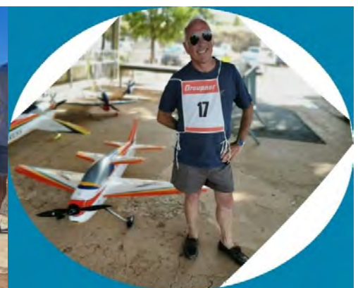
Championnat de France : avec son avion l'EXCESS