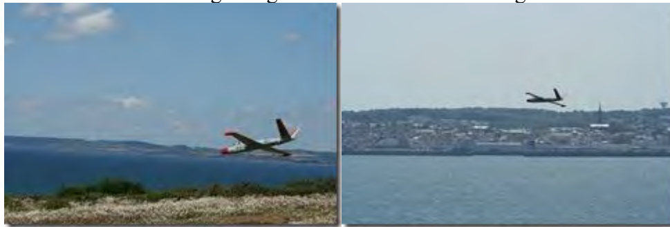
Douarnenez en arrière-plan.