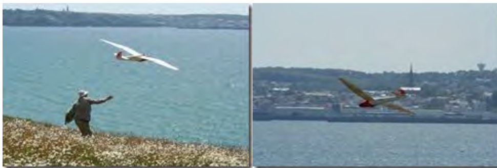
MiniMoa de Serge