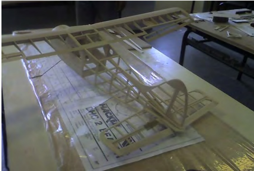
Une des nombreuses constructions réalisées par nos adhérents.