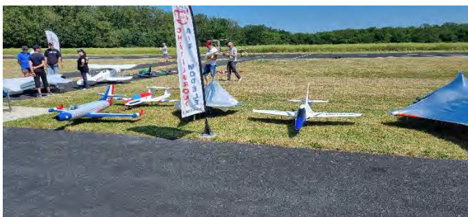
Au sol, puis en vol...