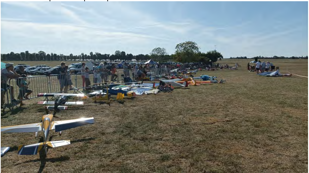
Le plateau et le public sous un soleil de plomb.