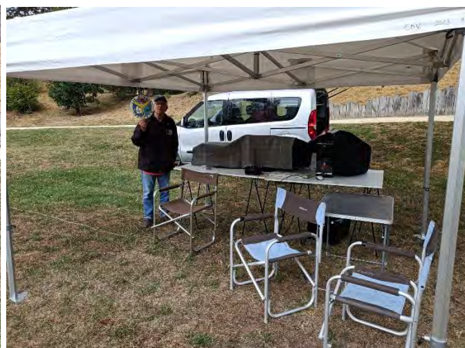
Temps pluvieux, on se protège comme on peut...