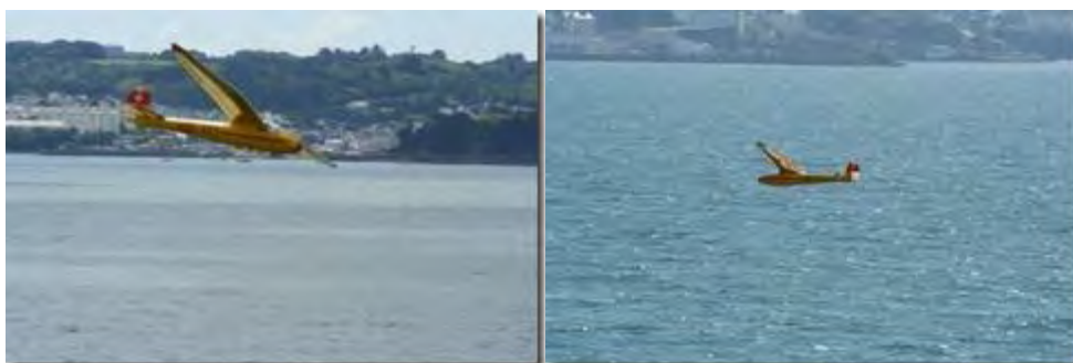
Spalinger de Doudou