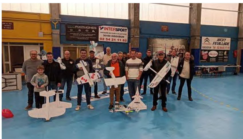
Le plateau des pilotes du concours