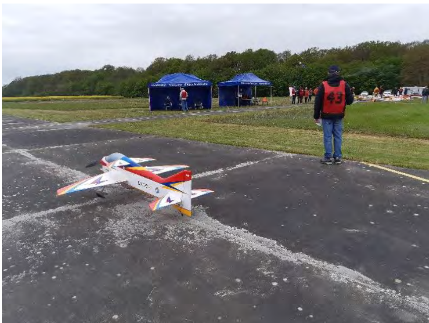
Conches : en attente du vol

La suite : Lironville (54) début octobre.