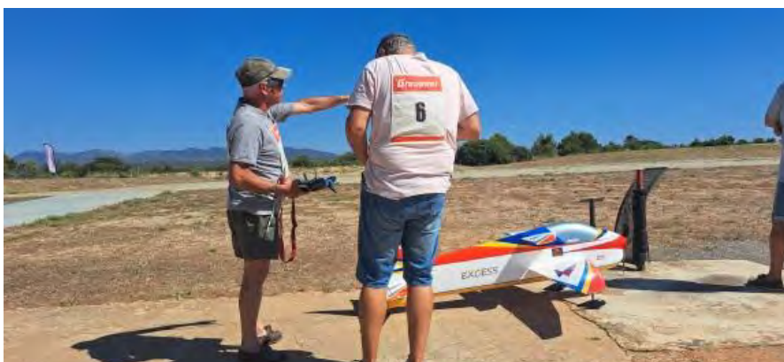
Briefing avant vol