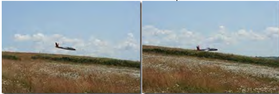
Retour du Fougas pour un atterrissage dans les marguerites.